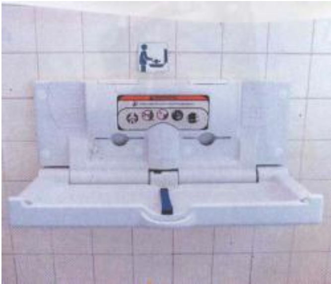
Table à langer Brocar