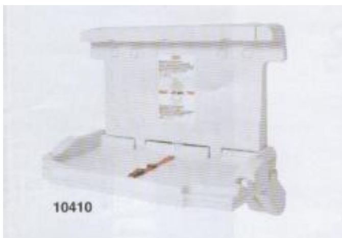
Table à langer Eco