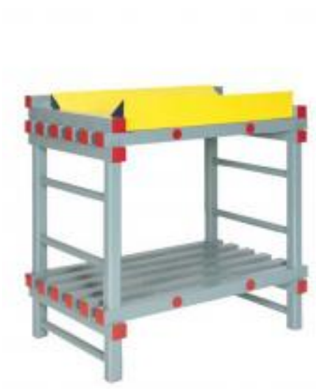
Table à langer idéal