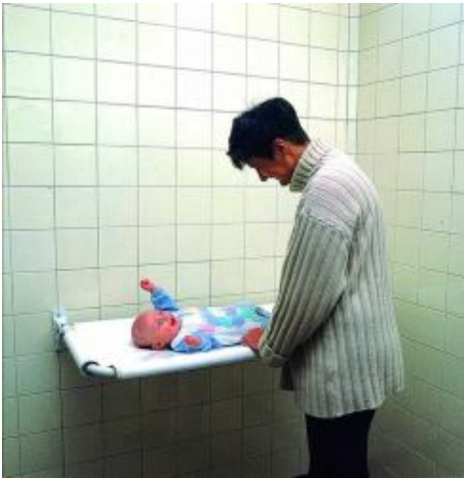
Table à langer Ep