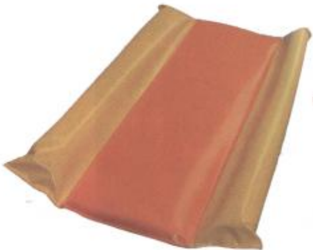
Matelas de change

-Structure alu plein, toile en polyester, dimension : 115x58x57 cm.