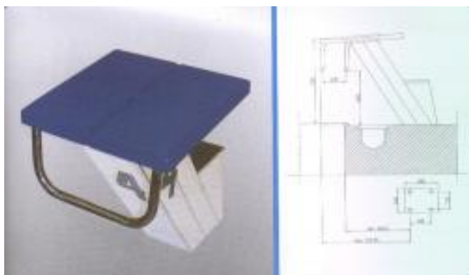
Plate forme antidérapante en ABS couleur bleu ou blanc. Structure en acier inoxydable AISI 316. Différentes positions possible, ajustement vers l'avant jusque 12 cm.