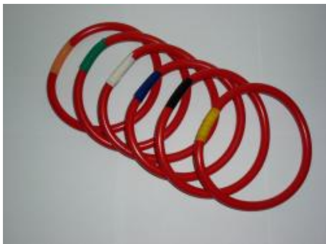
Anneaux Réf. : 10756

-Jeu de 6 anneaux lestés: marqués de couleurs différentes, restent droits au fond du bassin, couleur rouge.