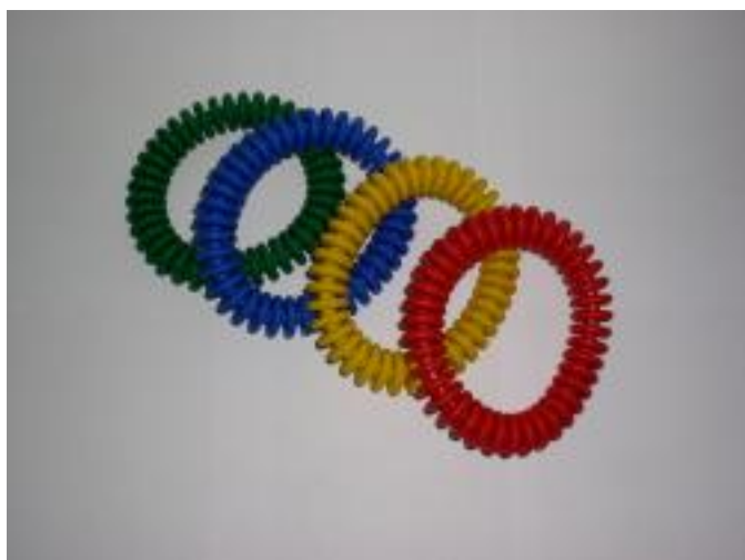
Anneaux lamelés Réf. : 11086

-Jeu de 6 anneaux lestés: marqués de couleurs différentes, restent droits au fond du bassin, couleur rouge.